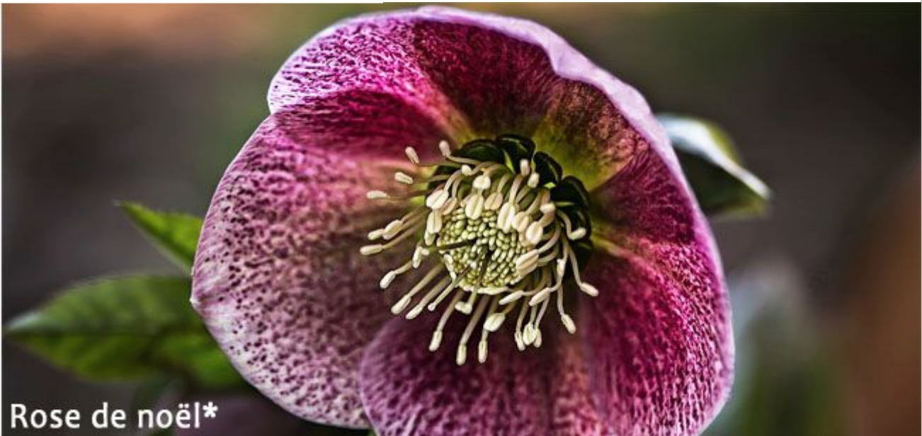
Rose de Noël*