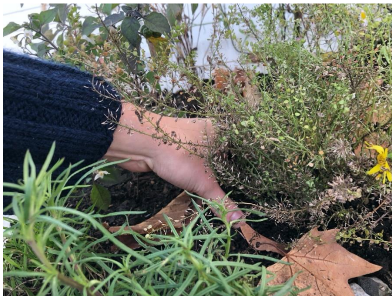
Ce carré sauvage a été entièrement réalisé à partir de « mauvaises herbes », fin novembre

Celles qui poussent près de chez vous, que vous soyez en ville, à la campagne, ou quelquepart entre les deux.