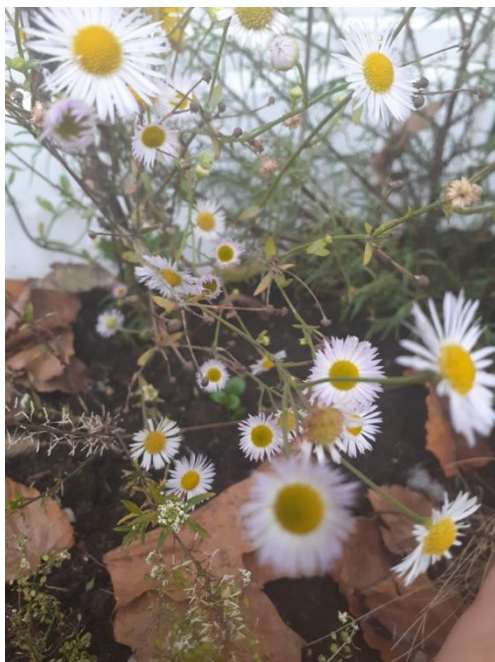
La Vergerette annuelle, Erigeron annuus

Voici celles qui ont servi à l'élaboration du carré sauvage, parmi les plus courantes en France et quelques autres possibilités :